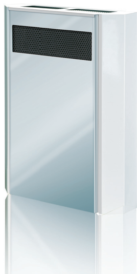
Centrala wentylacyjna „Micra”